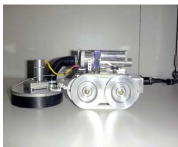
Alto torque com alcance de 30m