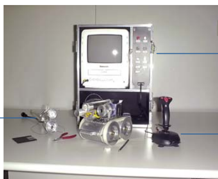
Módulo de controle e operação com tv colorida e vídeo para registro