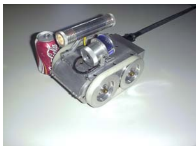
Multiferramenta de alta performance e desempenho

O Sistema Robotizado ROBÔ-IN oferece uma ampla gama de soluções em virtude do seu conjunto de acessórios e ferramentas, que o diferenciam em desempenho e confiabilidade quando da inspeção, limpeza e higienização de sistemas de ar-condicionados.